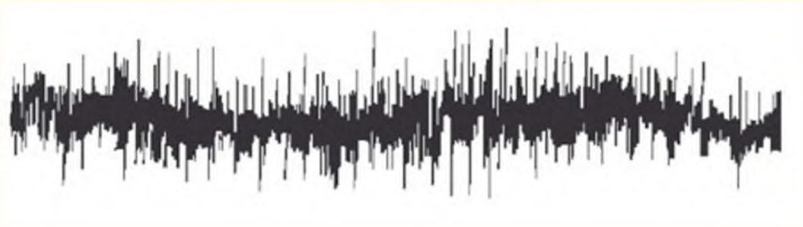
РИС. 3. Электромиограмма в норме

При слабом мышечном сокращении появляются периодические колебания биоэлектрической активности с амплитудой 100–150 мкВ. При максимальном произвольном мышечном сокращении амплитуда колебаний биоэлектрической активности нарастает. Как и сила людей, различающихся по возрасту и физическому здоровью, изменение амплитуды индивидуально и может достигать в норме 1000–3000 мкВ.