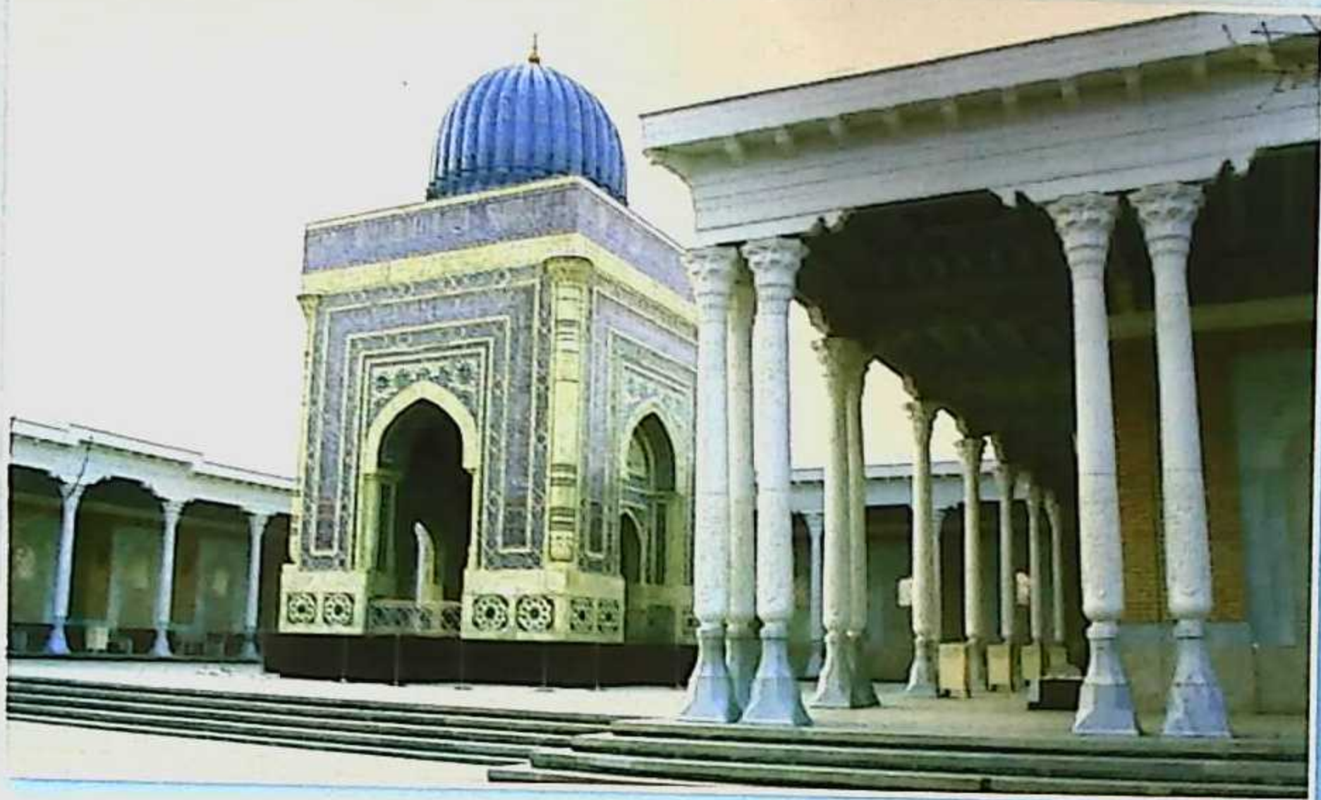
Imom Buxoriy maqbarasi