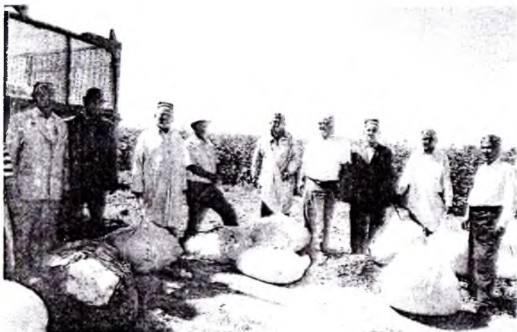
«Яхши дам-меҳнатга ҳамдам» тадбири иштирокчилари пахта теримида.