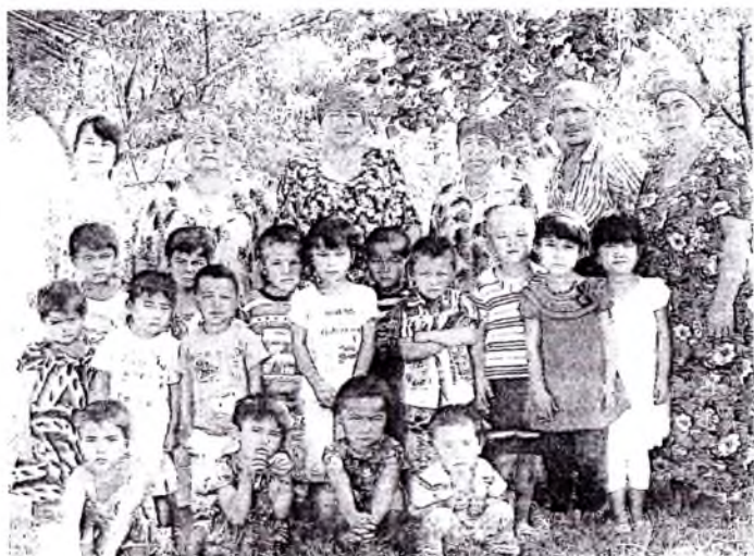
Кизирик туманидаги 23- мактабгача таълим муассасаси ходимлари ва тарбияланувчилари.