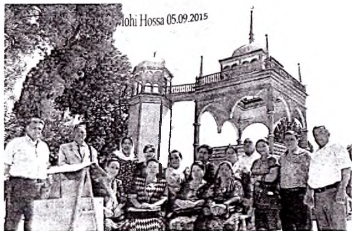
1977-1982 йилларда ТошДавМИда ўқиган битирувчилар Бухорода. (05.09.2015й.)