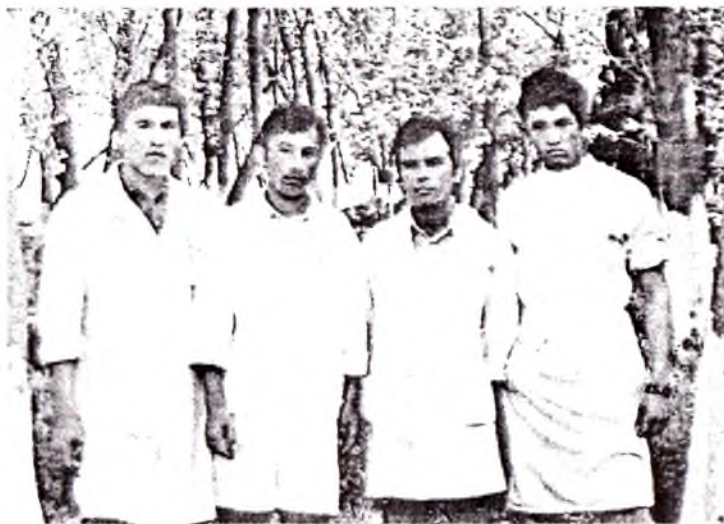
ТошДавМИда 1977-1982 йиллар ўқиган талабалар.