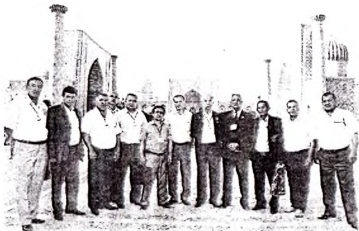
1977-1982 йилларда ТошДавМида ўқиган битирувчи- ларнинг Самарқанддаги учрашуви. (08.09.2012 й.)