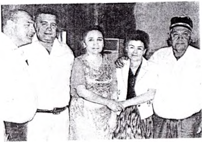
ТошДавМИнинг 1982 йилги битирувчилари.