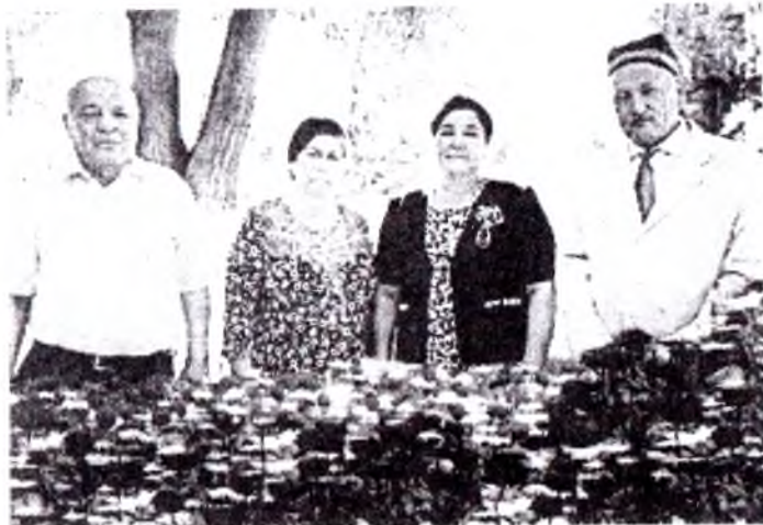
1977-1982 йилда ТошДавМИни тугатган курсдошлар учрашуви.