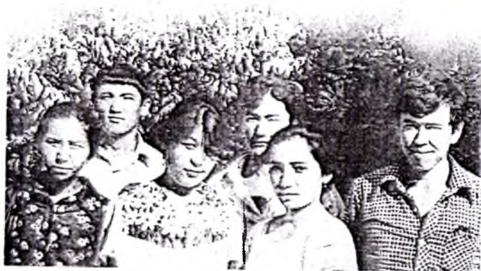
ТошДавМИ стоматология факультети талабалари.