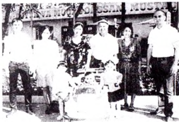
Абдималик Нормўминовлар оиласи.