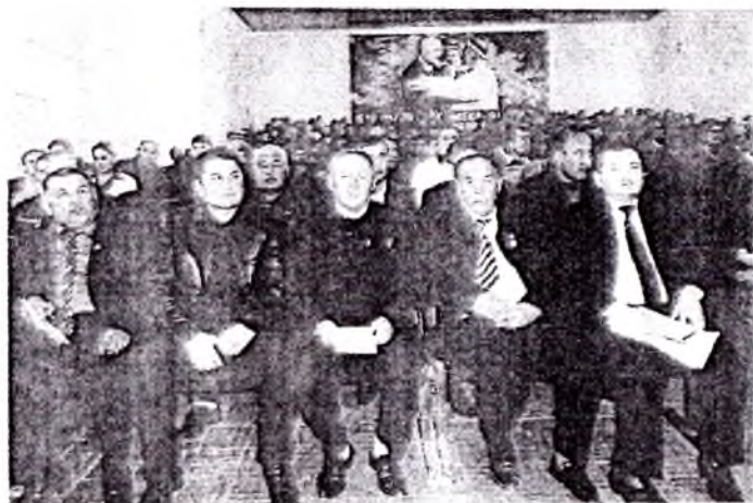
Ўзбекистон халқ бахшиси Х.Мардонакулов Фёоллар билан.