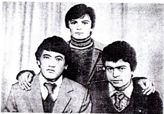
ТошДавМИда 1977-1982 йиллар тахсил олган битирувчилар.