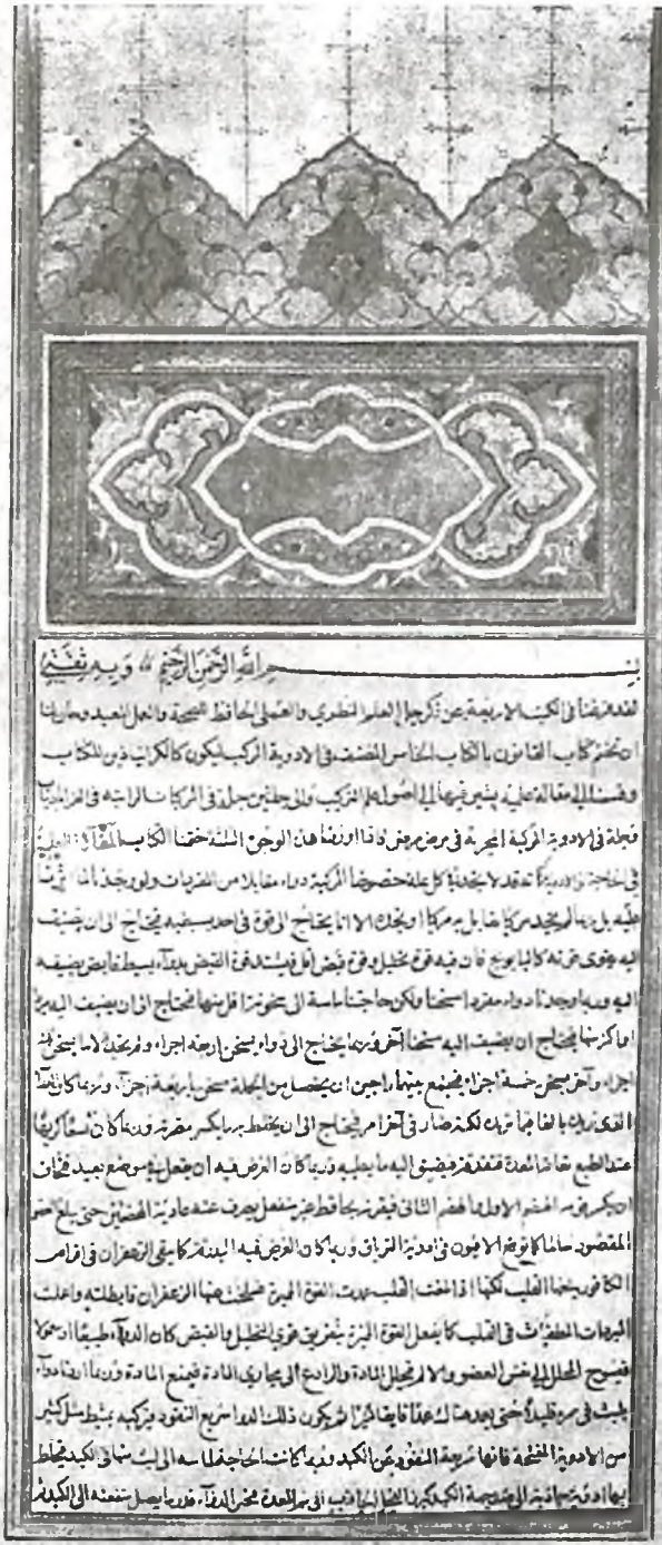
«Қонун» V китобининг биринчи саҳифаси. ЎЗР ФА Шарқшунослик институтида сақланаётган 3316 рақамли кўлёзма.