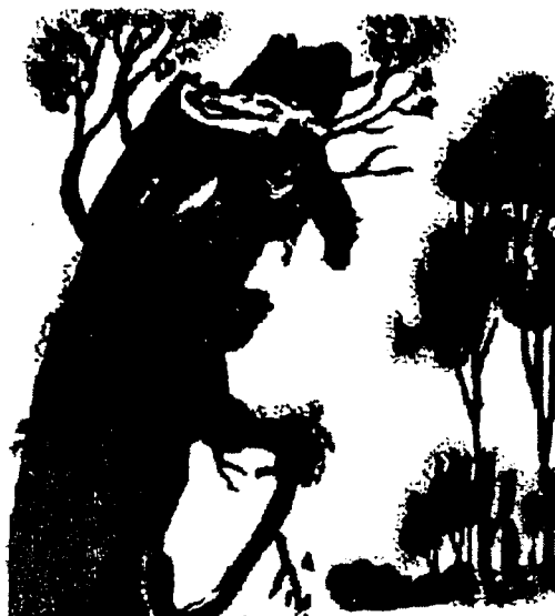
Муҳитни иллюзор (хаёлий) идрок этиш.

Булар соғлом одамда чарчаганида пайдо бўлиши мумкин. Гипногагик ва гипнопомпик галлюцинациялар баъзи ҳолларда интоксикацион ва инфекцион психозларнинг бошланғич даври бўлиши мумкинлигига қарамасдан, беморда психотик ҳолат деб баҳолашга асос бўлолмайди.