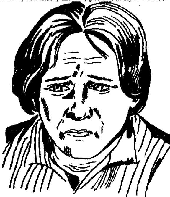
Депрессив синдромда беморнинг мимикаси.

Кўтаринки кайфият —маниакал синдромга хос. Турғун, асосланмаган кўтаринки, хурсанд кайфият ҳолати бўлиб, беморнинг фаоллиги ошиши билан кечади. Маниакал-депрессив психознинг маниакал фазасида, шизофренида кузатилади.