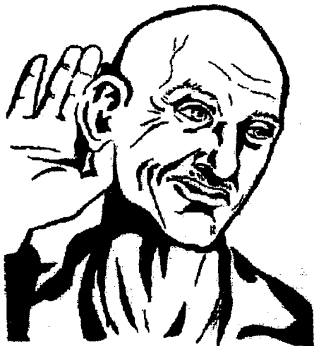
Эшитув галлюцинацияли беморнинг кўриниши.

Сурункали галлюциноз сезиларли аффектив бузилишларсиз ва етарли даражада галлюцинатор васваса билан кечади.