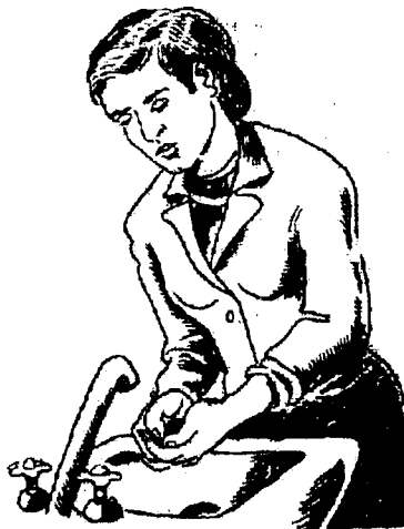
Тинимсиз қўл ювиш симптоми

Асосий касалликнинг тавсифига қараб ақлсизлик юқори — олий интеллектуал фаолиятга тегмайди (анализ ва синтез хусусиятлари), балки интеллектнинг анчагина оддийроқ функцияларига, хусусан эслашга, ҳисоблашга, диққатга, мушоҳада, шахсият, ўз ҳолатига танқиди ва одоби узоқ вақт сақланиб қолади. Бундай беморлар шифокор ёрдамида фаол интиладилар, одатдаги касбга тегишли бўлган фаолиятлари ҳам узоқ вақт сақланади. Ўчоғли ақлипастлик бош мия томирларининг касаллигида (церебрал атеросклероз), хафақон касаллигида, мия захмида учрайди.