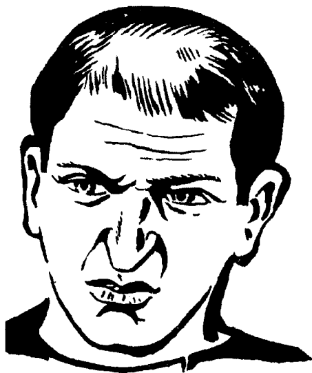
Ҳидлов галлюцинацияли беморнинг мимикаси.

Берс Конрад (1954) галлюцинози тери сезгиси ўзгариши вас- васаси. Қарилик олди даврида пайдо бўлиб, бемор баданида ҳашаротлар, бит, чувалчанг, қўнғиз, кана юргандек ҳис қилади ёки майда шиша, қум ботишини тери ёки тери остида ҳис қилади.