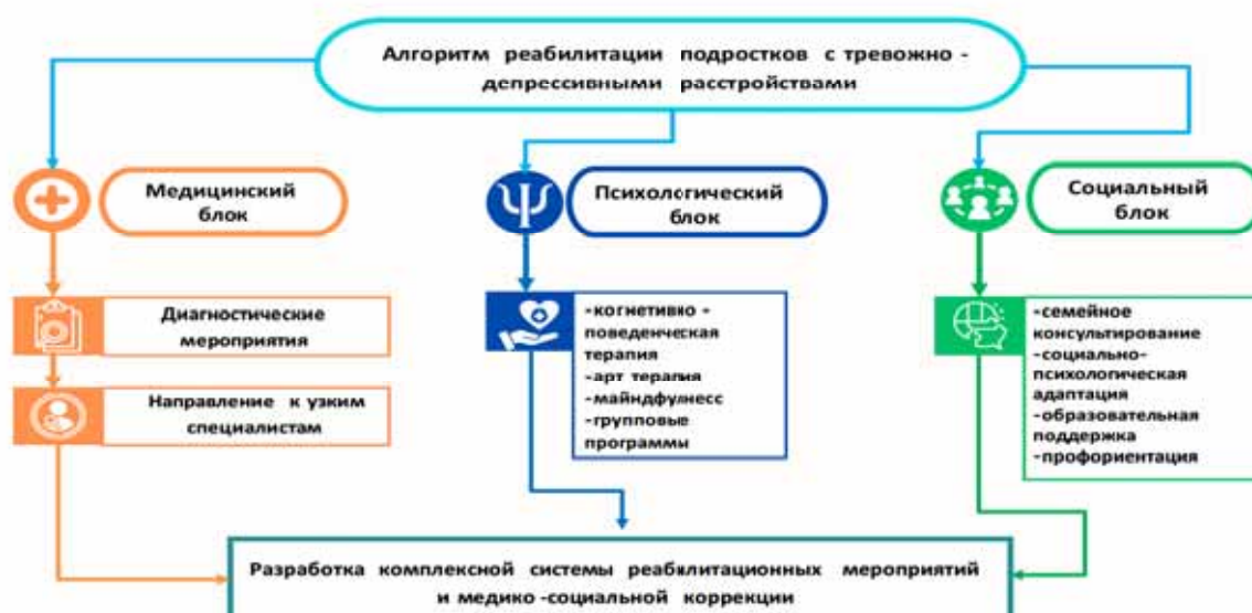
Рисунок 5.1. Алгоритм реабилитации подростков с тревожно-депрессивными расстройствами

Разработанная и апробированная комплексная система реабилитации и медико-социальной коррекции тревожно-депрессивных расстройств у подростков продемонстрировала высокую эффективность. Применение биопсихосоциального подхода, этапности реабилитационного процесса и дифференцированных программ в зависимости от клинического варианта ТДР позволяет значительно улучшить клинические и социальные исходы, снизить риск хронификации расстройства и предотвратить рецидивы.