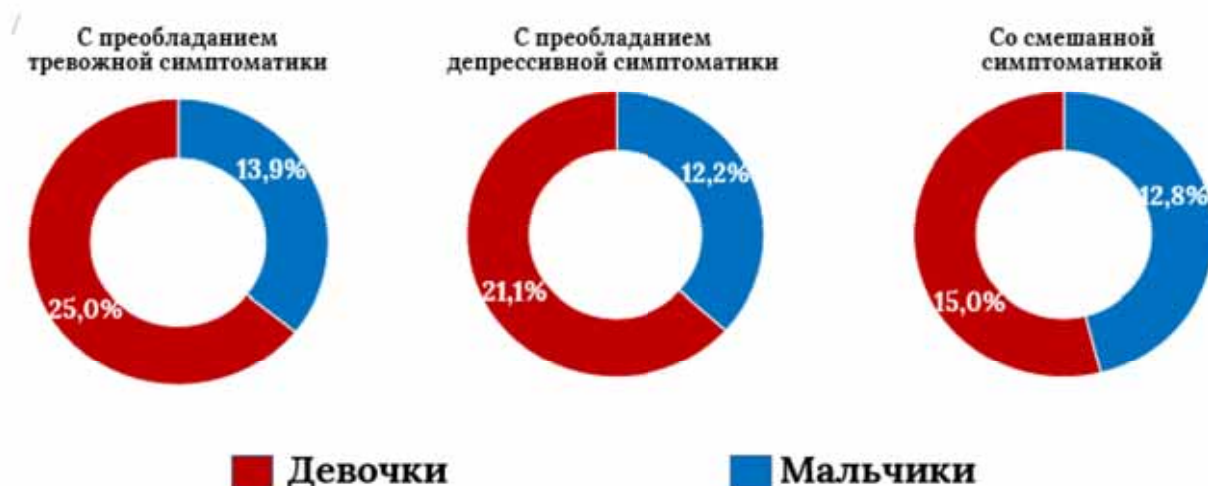
Рисунок 3.1. Распределение подростков по клиническим характеристикам (%)

На рисунке 3.1. показано преобладание тревожной симптоматики: отмечались 25% у девочек и почти 14% у мальчиков. Это говорит о том, что у девочек чаще наблюдаются тревожные проявления, включая вегетативные реакции, гиперчувствительность к стрессу и повышенную тревожность. С преобладанием депрессивной симптоматики 21,1% у девочек, у мальчиков 12,2%. Девочки также чаще демонстрировали симптомы подавленного настроения, апатии и сниженной самооценки. Смешанная симптоматика здесь сочетание тревожных и депрессивных признаков отмечалась 15,0% у девочек, 12,8% у мальчиков. Такая картина указывает на то, что смешанные формы встречаются у обоих полов с приблизительно равной частотой, но всё же немного чаще у девочек. Это говорит о том, что, девочки-подростки чаще страдают как тревожными, так и депрессивными формами расстройств, что может быть связано с эмоциональной лабильностью, социальной уязвимостью и особенностями полового созревания.