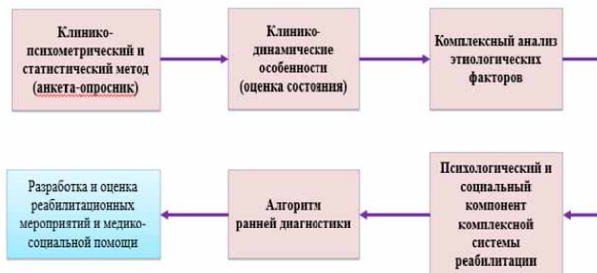
Рисунок 2.1. Этапы исследования

На рисунке 2.1. представлена развернутая логическая схема исследования, иллюстрирующая поэтапную организацию научной работы: диагностики, анализа и разработки эффективной системы реабилитационных мероприятий при тревожно-депрессивных расстройствах у подростков. Данная схема включает использование клиничко-психометрических методов и статистической обработки данных, определение клиничко-динамических особенностей состояния, анализ этиологических факторов, формирование алгоритма ранней диагностики и последующую разработку медико-социальной и психологической помощи в рамках комплексной системы реабилитации.